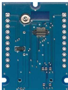
上面 (IMBLE 取付け面)